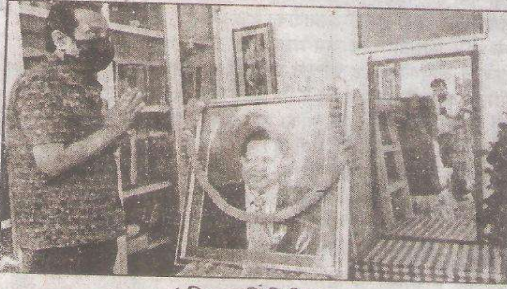
( निज प्रतिनिधि )

पटना। पब्लिक अवैयरनेस फॉर हेल्थफुल एंप्रोच फॉर लिविंग पहल नेमा प्लेस एक्जीविशन रोड के तत्वावधान में